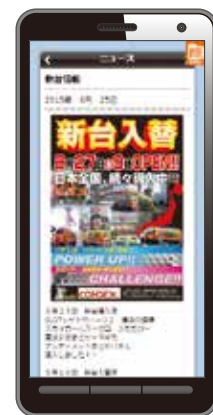
■スマホ・アプリ版